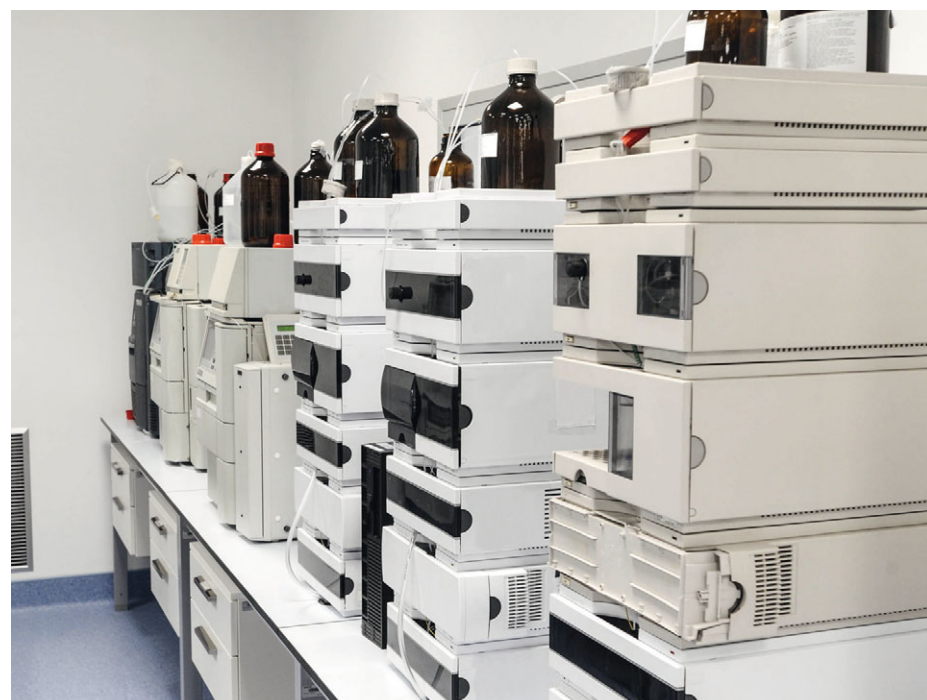
Kvalitetskontroll (QC) är en stor och viktig del i färdigställandet av ett läkemedel, omgärdat av myndighetsregler för att man ska undvika misstag.

Ansökan gäller nio miljoner kronor och företagen väntas bidra med lika mycket.